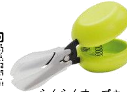
カスタネットはさみ #4 CASTA SCISSORS