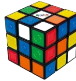
ルービックキューブ #5 RUBIK'S CUBE