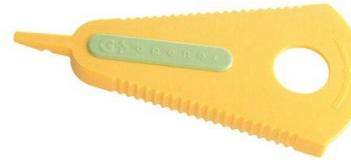
らくらくオープナー #6 RAKURAKU OPENER