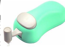
ライン・紙カッター #3 LINE PAPER CUTTER