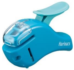
ハリナックス #1 STAPLER