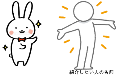
紹介したい人の名前